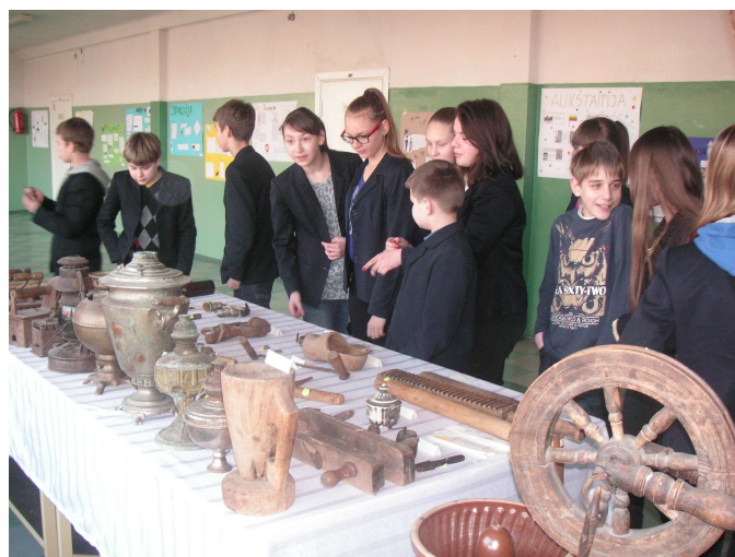
Mokiniai apžiūri etnografinę parodą