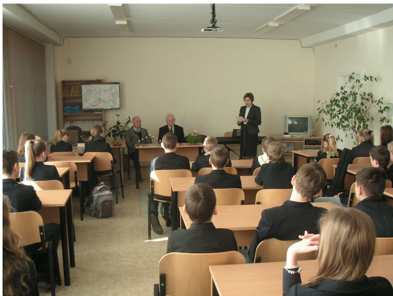
Susitikimas su tremtiniu