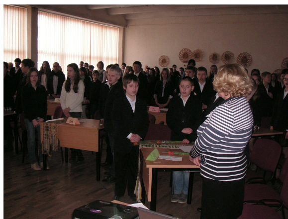
Kovo 11-osios minėjimas